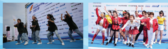
津久井浜海岸 音楽やダンスを中心とした多彩なステージイベントが開催され、風待ち時間も多くの人が楽しんでいました。