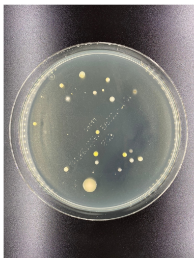
設置直後の空気質